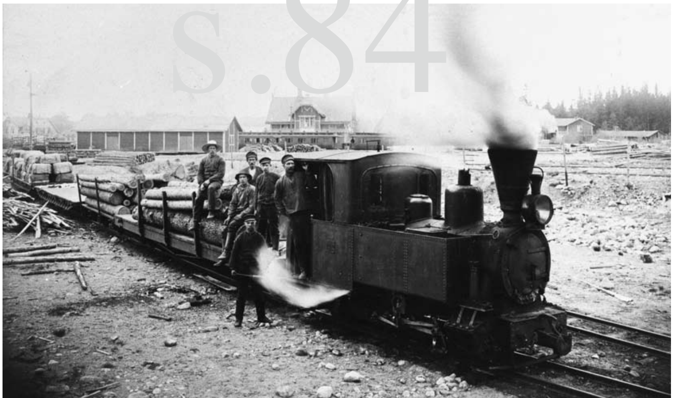
Infart till bruket, vykort från 1920-talet. Franska loket i Bor med BAJ-tåg i bakgrunden, 1910-talet.