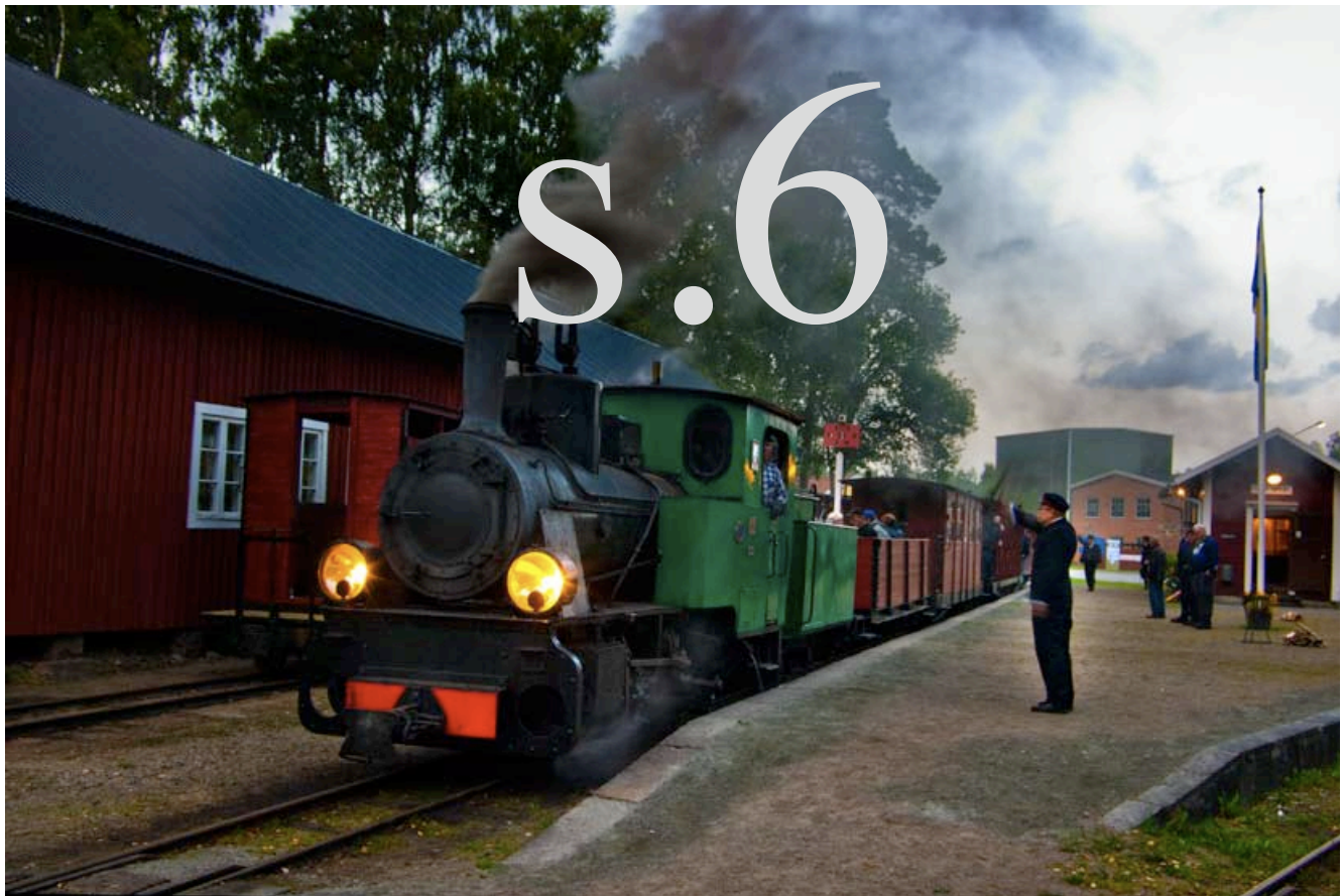
Biljettluckan och Polska loket som skall dra ett kvällståg.